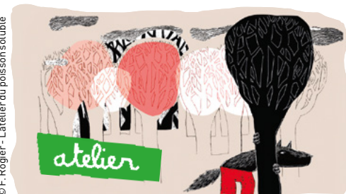
© F. Rogier - L'atelier du poisson soluble