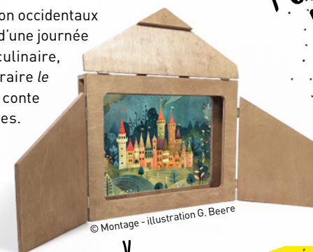
© Montage - illustration G. Beere

..... À noter : à 10h30, Lectures de contes détournés pour les 2 - 4 ans Dans le cadre des Nuits de la lecture.