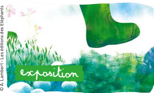
© A. Lambert - Les éditions des Éléphants

28 SEPT. - 6 NOV. ▲ BIBLIOTHÈQUE ANDRÉ MALRAUX - 6 E