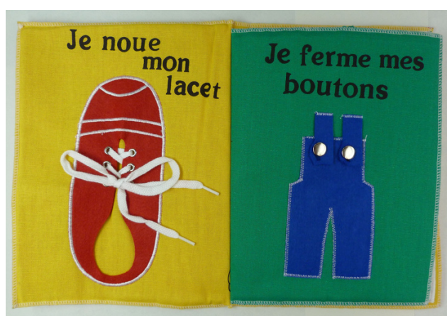
Fais-moi apprendre. [Lieu et éditeur inconnus, entre 1950 et 1970], 8 p.