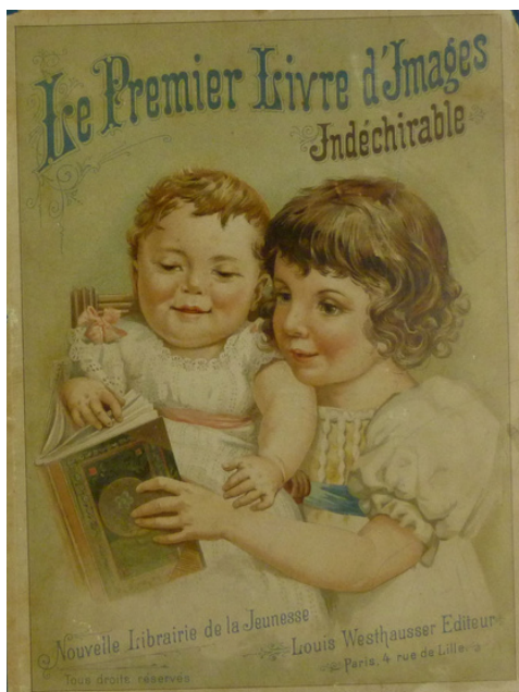
Le premier livre d'images. Paris, Nouvelle Librairie de la jeunesse, Louis Westhausser, Editeur, [vers 1880], 12 p.