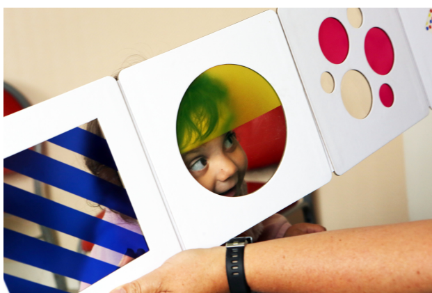
Dans la salle d'attente, lire ensemble à la PMI. OLIGNY Louise (photographie). Agence quand les livres relient. Séance de lecture partagée à la PMI de Malestroit avec l'association Tribu en filigrane (56), 2022, 20 p.