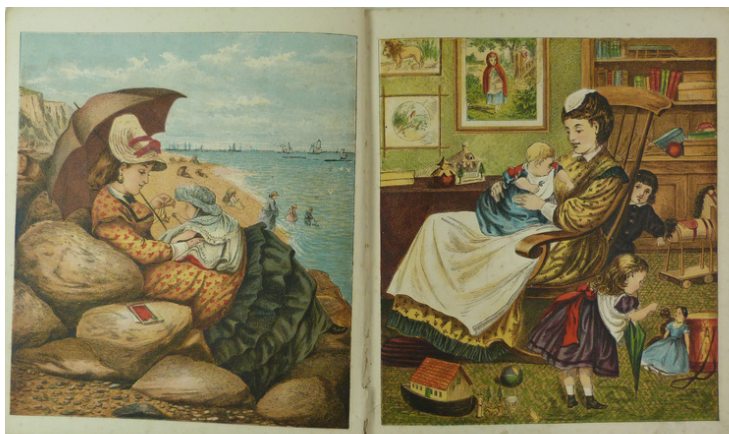
Monsieur Bébé. Paris, Librairie Hachette et Cie (Magasin des petits enfants, 1ère série), [date inconnue], 12 p.