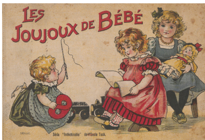
Les joujoux de bébé. Paris, Librairie Artistique de la jeunesse, Raphael Tuck & fils, Éditeurs (Série Indéchirable de l'Oncle Tuck), [vers 1900], 12 p.