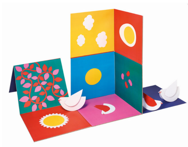
Le nid. FÉLIX Lucie. Paris, Les grandes personnes, 2022, 9 panneaux reliés en 3 oiseaux en papier.