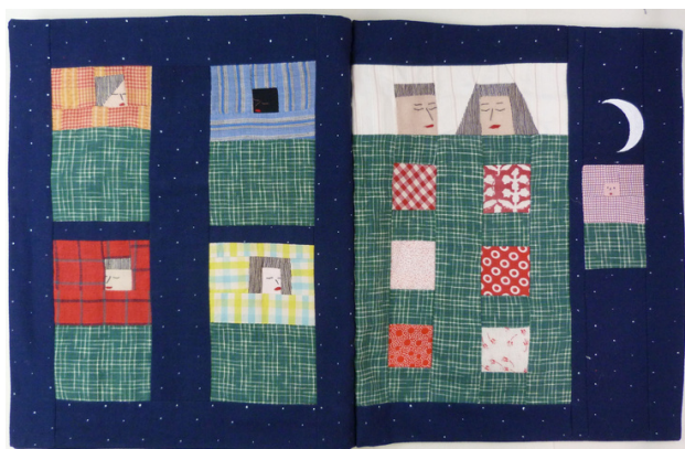
Au lit. CUMONT Louise-Marie. Livre d'artiste, exemplaire n° 37/45, 2023, 14 p.