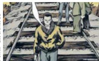
© Chico - Les arènes BD

À dix-huit ans, Mario s'enfuit du Portugal dans le coffre d'une vieille voiture. Lâché par son passeur à la frontière franco-espagnole, il rencontre